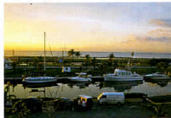
Le décalage horaire avec la France est de 6 heures, été comme hiver.

routes côtières permettent des balades soit en direction de Guantanamo - la dernière base américaine où sont détenus les membres d'Al Qaida - avec des haltes plaisantes sur les plages, des promenades au parc de Baconao et l'escalade de la Gran Piedra. Ou encore la visite de la Vallée de la préhistoire qui présente la reconstitution grandeur nature de 250 dinosaures et d'un homme des cavernes géant. Il convient de préciser qu'avant sa découverte par les Espagnols, Cuba était habitée par des civilisations évoluées et pacifiques, telles que les Siboneys et les Taïnos.