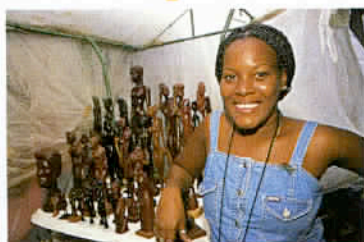
L'artisanat local s'améliore mais demeure peu créatif.

D'ailleurs, le fameux Compay Segundo, immortalisé par la caméra de Wim Wenders dans son documentaire «Buena Vista Social Club» naquit en 1907 à Siboney, un village à 10 km de Santiago. En outre, dans cette région de l'Oriente, une part importante de la population tire ses origines du continent africain, ce qui explique le type afro-cubain que l'on y rencontre, dans une société multiraciale où l'éradication du racisme est également à porter au crédit de la révolution qui hérita en 1959 d'une situation de quasi-apartheid. Au départ de Santiago, de belles