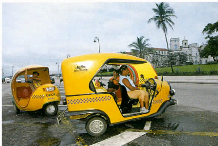
Les taxis-bicis, triporteurs à pédales ou les taxis-cocos, également à trois roues mais équipés d'un moteur, permettent de parcourir La Havane.