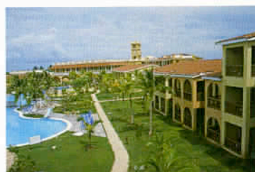
Pour Cuba : un passeport valide et une carte de tourisme à 23 €.

pas l'équivalent de 20 dollars par mois ! Sans oublier les nombreuses pénuries dont les Cubains sont victimes. Une situation aggravée par un embargo appliqué impitoyablement depuis 1960 par les Etats-Unis, qui n'a plus de raison d'être, si ce n'est de pénaliser injustement la population insulaire. Car, si de nos jours nul n'ignore les vicissitudes du régime castriste, notamment en matière de liberté d'expression, de circulation, d'entreprise, d'homophobie et de peine de mort... force est de reconnaître, pourtant, les indéniables acquis hérités de la révolution populaire, au premier rang desquels la médecine et l'école gratuites pour tous. Une santé et une éducation publiques, irremplaçables socles de construction de la solidarité nationale, à partir desquelles tous les espoirs sont permis. En tout état de cause, la destination Cuba ne se résume pas à une liste de dysfonctionnements, loin s'en faut. Et c'est à une traversée de plus de mille kilomètres, d'Est en Ouest de