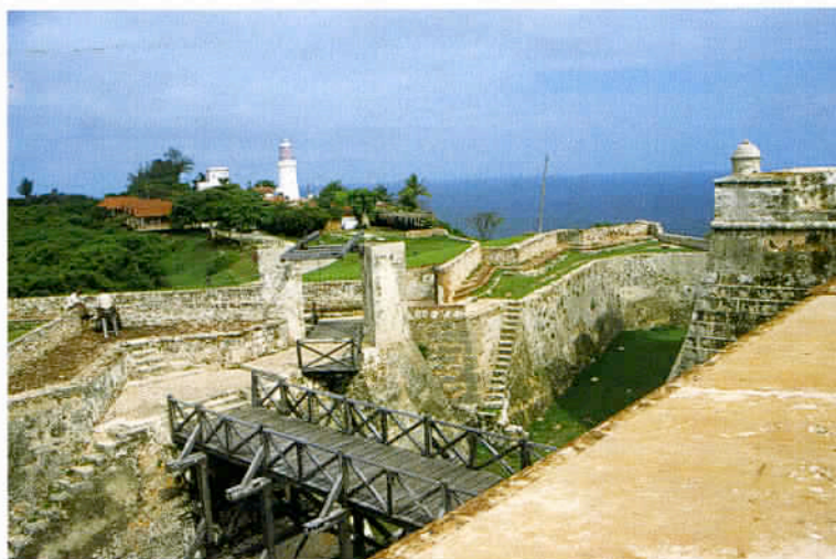
L'île porte encore les traces de son appartenance à la couronne espagnole, avant qu'elle soit aux mains des Etats-Unis, de 1898 à 1959.