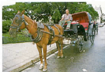
L'île n'échappe pas aux traditionnelles attractions touristiques.

D'ailleurs, le fameux Compay Segundo, immortalisé par la caméra de Wim Wenders dans son documentaire «Buena Vista Social Club» naquit en 1907 à Siboney, un village à 10 km de Santiago. En outre, dans cette région de l'Oriente, une part importante de la population tire ses origines du continent africain, ce qui explique le type afro-cubain que l'on y rencontre, dans une société multiraciale où l'éradication du racisme est également à porter au crédit de la révolution qui hérita en 1959 d'une situation de quasi-apartheid. Au départ de Santiago, de belles