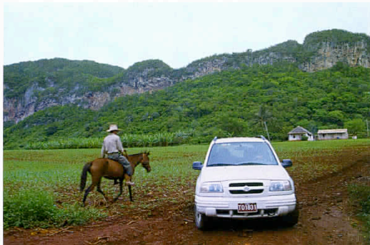
La région agricole de Pinar del Rio permet de sortir des sentiers battus et d'aller à la rencontre des populations installées dans des endroits reculés.