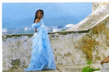
La cérémonie des Quinze Ans. Le passage de l'adolescence à l'âge adulte.

né d'hommes tels que Cespedes, Maceo, Gomez et José Martí. Pour en revenir au tourisme, la route qui longe la côte de Santiago en direction du pic Turquino, point culminant de Cuba à 1 974 m, est également de toute beauté. Un peu à l'écart, au km 18, l'église d'El Cobre dresse ses coupes au beau milieu d'un cadre verdoyant et héberge une statue de la Vierge de la charité qui en fait l'un des lieux favoris de pèlerinage des Cubains. Ensuite, la ville à dominante coloniale de Camagey, une étape de transition, se situe à 328 km de Santiago. L'une des meilleures façons de