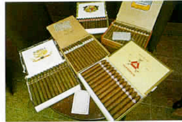
Cuba produit toujours les meilleurs rhums et cigares du monde.

rencontrer les Cubains consiste à les prendre en stop. En dehors du réel service que vous leur rendez, eu égard à la situation catastrophique des transports en commun locaux, c'est surtout l'occasion de partager sans aucune appréhension des moments inoubliables, de même que dans les Paladares, des tables d'hôtes tolérées par le régime, quête du billet vert oblige. Pour dix dollars, on y déguste chez l'habitant une succulente langouste, denrée réservée aux touristes, comme la plupart des meilleurs produits. Puis à Trinidad, l'étape suivante, c'est une ville clas-